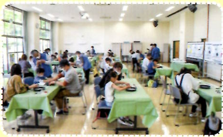
「勾玉ざんまい」の様子