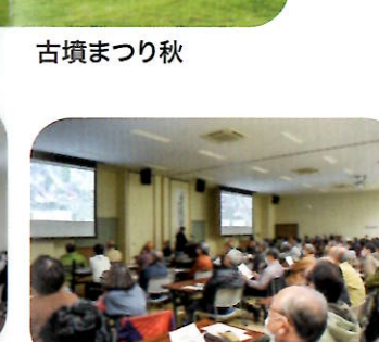
第2回企画展記念講演会