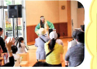
まりこふんコンサート