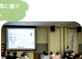
第1回企画展記念講演会