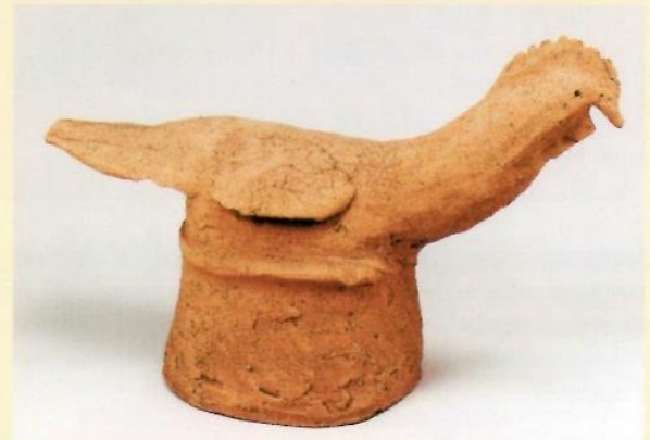
天王壇古墳出土鶏形埴輪

天王壇古墳からは、たくさんの埴輪が出土しています。東北地方の埴輪を考える上で重要な古墳の1つで、円筒埴輪・人物埴輪・動物埴輪・器材埴輪という具合に、埴輪の種類は多様です。鳥の形をした埴輪は3点あり、1点が水鳥、2点が鶏です。