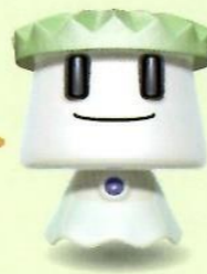
大安場くん (史跡公園キャラクター)