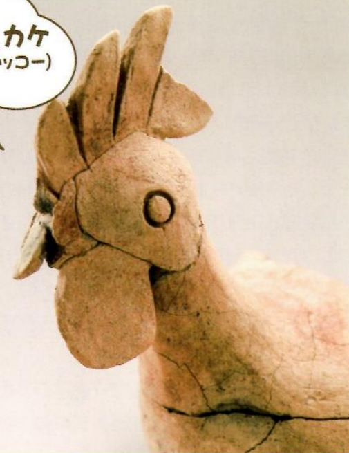
津古生掛古墳出土土鶏形容器