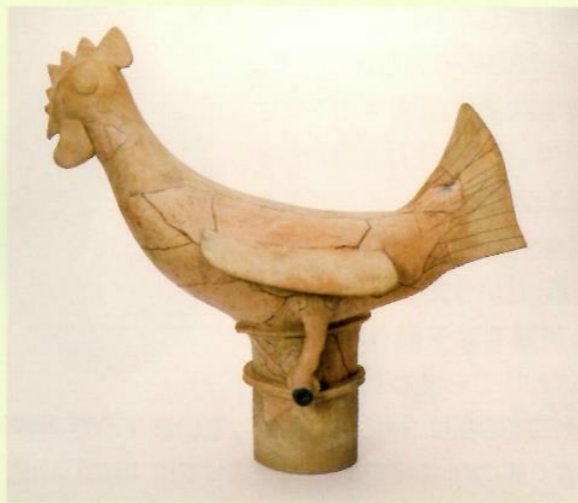
纏向遺跡出土鶏形埴輪

ように、船は2艘描かれており、その2艘とも船先には鳥が表現されています。そのうち上段の船に描かれた鳥は、鶏冠と立派な尾羽の表現から、雄の鶏であるとわかります。古墳に葬られた人物を、死者の国へと導くための役割を果たしているようにも感じられます。特別な能力を持つ神聖な鳥としての鶏の性格を、よく表した造形です。