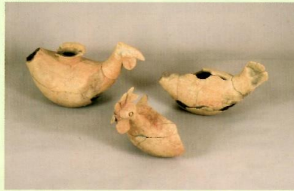
津古生掛古墳出土鶏形容器

奈良県天理市にある古墳時代前期の3世紀後半に造られた東殿塚古墳からは、船の描かれた円筒埴輪が出土しました。右頁上の写真に見られる