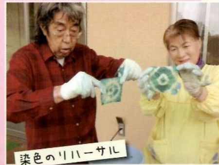
染色のリハーサル