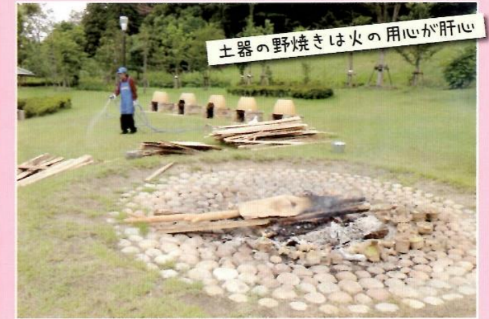
土器の野焼きは火の用心が肝心