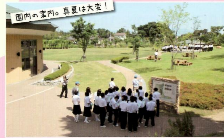
園内の案内。真夏は大変！