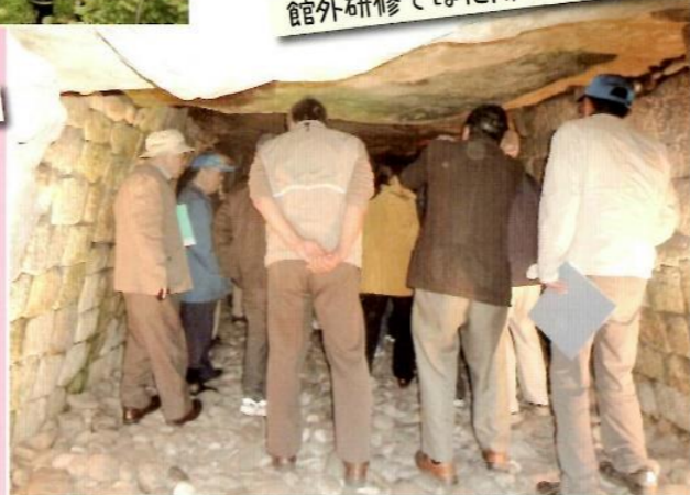
館外研修では他所の古墳を見学