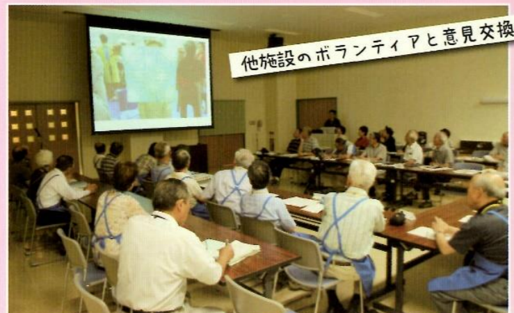
他施設のボランティアと意見交換