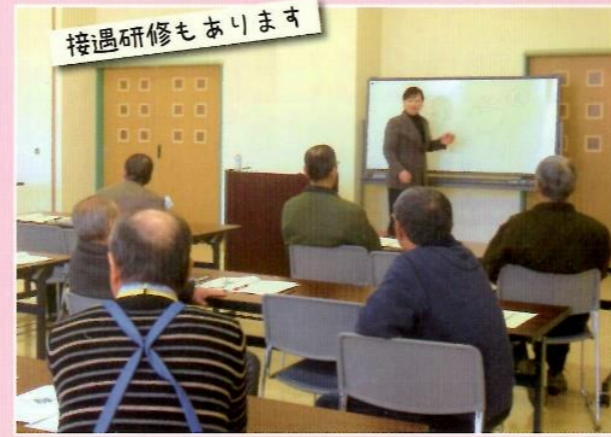
接客研修もあります