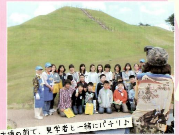
古墳の前で、見学者と一緒にパチリ♪