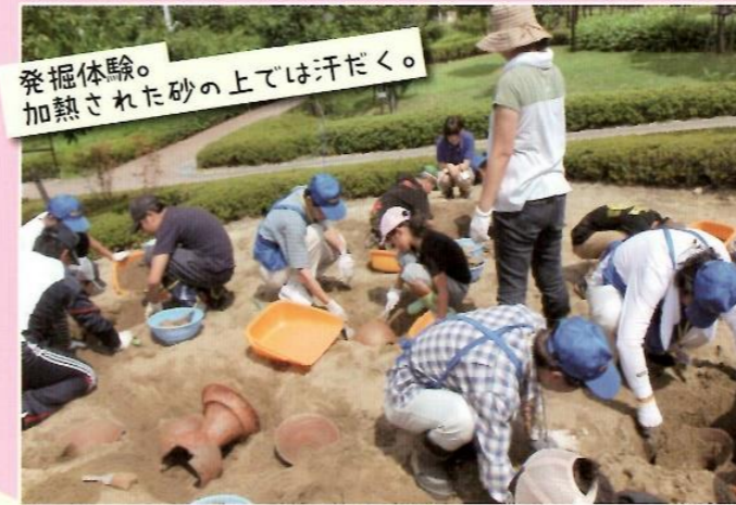
発掘体験。 加熱された砂の上では汗だく。