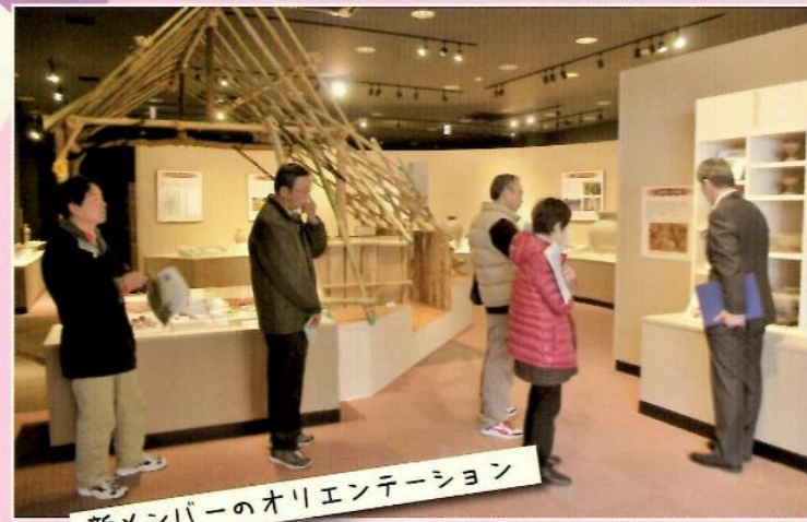
新メンバーのオリエンテーション

メンバーのみなさんには、現在も社会でご活躍されている方だけでなく、主婦や退職された方もおり、まさに多種多様。色々な経験をバックボーンに身に付けられた知恵は、来園された方だけでなく我々スタッフの強力なサポートとなっています。縁の下の力持ちながら、まさに、キラリと光るおおやすばのもう一つのたからものなのです。