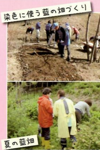
染色に使う藍の畑づくり