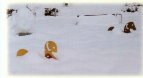
1号墳の麓では、遊具たちが雪に埋もれていました。