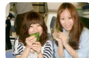
むすびあがったちまき