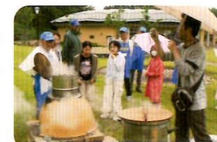
ちまきを蒸す様子を見る参加者