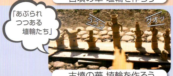
古墳の華 埴輪を作ろう