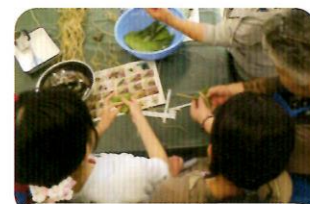
ボランティアスタッフのアドバイスでちまきを作る参加者

解説に飽きたら石臼体験です。ちまきに付けるきな粉を石臼でひきました。きな粉をつけての試食の後には「おいしい」「うんとウマイっ!」「初めてでよかった」「次は自分で蒸したい」などといった感想をお寄せいただくことができました。みなさん、雨の中おつかれさまでした!