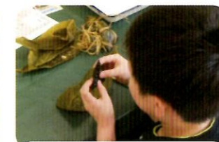
ちまきを試食する参加者