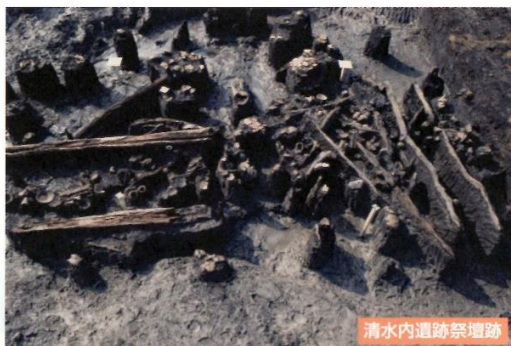
清水内遺跡祭壇跡

遺跡は郡山市大槻町に位置します。「清水内」という地名が端的に示すように水が豊富な場所にあり、古墳時代中期の水に関する祭祀の場が確認されました。