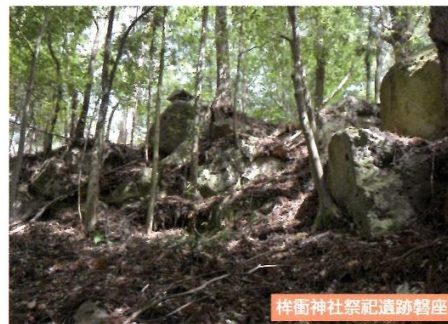
樺衝神社祭祀遺跡磐座