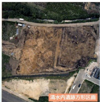
清水内遺跡方形区画

清水内遺跡の重要性の一つは、畿内で創出された祭祀の変遷が明瞭に認められることにあります。①河川で祭壇状の木組みが作られ、水を対象とした祭祀が行われる、②祭祀の場と考えられる柵と溝に囲まれた方形区画遺構の出現、③石製模造品という新たな祭祀遺物の導入が図られる、というように、集落の推移する中で明確に祭祀の変遷が確認されたことは、地方における祭祀の変遷を考える上で特筆すべきものです。