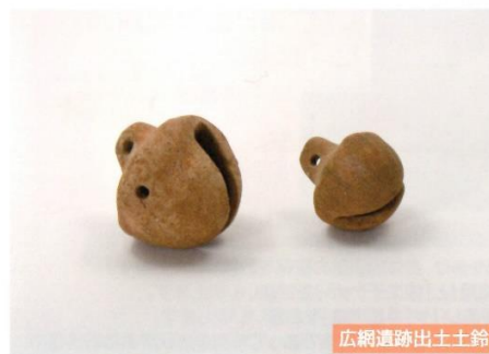
広網遺跡出土土鈴

遺跡は郡山市西田町に位置する、集落と併せて窯や工房と一緒に確認された遺跡です。奈良時代から平安時代の遺跡で、土鈴の出土が特徴的です。出土したものの中には、球体の両側面に孔をあけ共鳴効果を上げているもの、丸を2個いれたものなど、様々なものがあります。土鈴は、奈良～平安時代の土器製作に関わりのある集落や窯跡からの出土が多いという特徴があります。