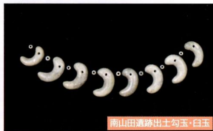
南山田遺跡出土勾玉・白玉

郡山市南東部の田村町に位置する遺跡で、110棟を数える5世紀後半の竪穴建物確認されました。このうち66号住居からは白玉230点と双孔円板5点が出土し、79号住居からは精巧な作りの勾玉が8点発見されました。遺跡では石製模造品の製作工房跡が見つかっており、集落内部で石製祭祀遺物が作られていました。