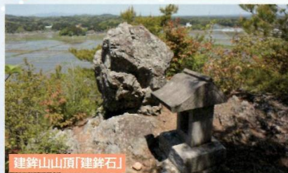
建鉾山山頂「建鉾石」