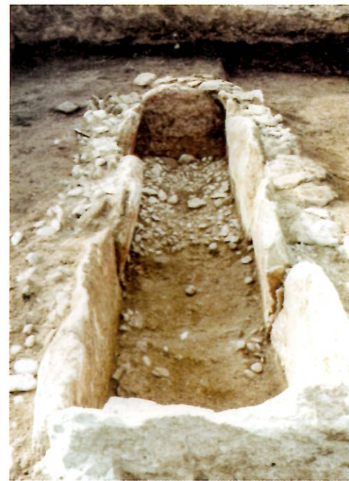
正直27号墳南箱式石棺