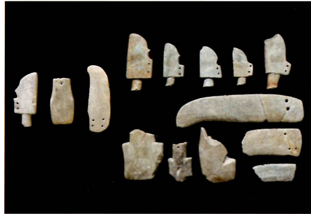
塚野目11号墳出土石製模造品(国見町所蔵)

11号墳は、一辺約18mの方墳で、刀子形・斧形・鎌形の石製模造品が出土している。石製模造品の特徴から5世紀前半に比定され、古墳群内では最も初期に築造された古墳と考えられる。