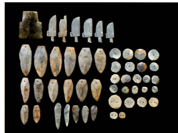
正直27号墳南箱式石棺出土石製模造品(郡山市所蔵)

いずれの石棺からも石製模造品が出土した。そのうち南箱式石棺出土のものは、斧形1点・刀子形6点・剣形19点・有孔円板24点である。