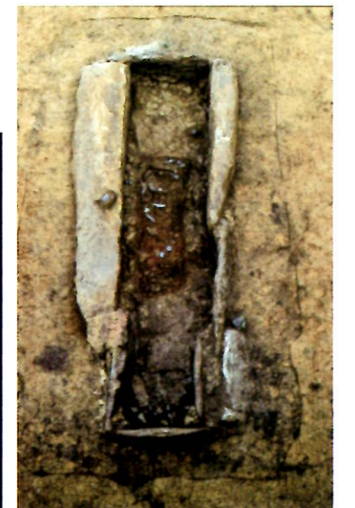
小浜2号墳箱式石棺(富岡町)