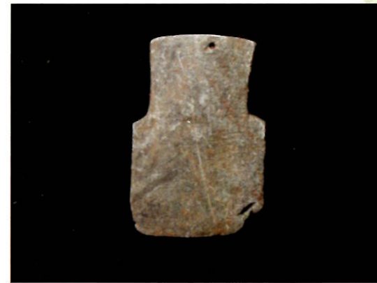
天王壇古墳出土斧形石製模造品(個人所蔵)

造品が出土している。このうち刀子形については、同じ特徴をもつものが白河市建鉾山祭祀遺跡・栃木県宇都宮市雷電山遺跡から出土している。