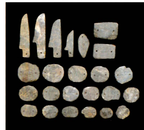
小浜2号墳出土斧形石製模造品(富岡町、とみおかアーカイブ・ミュージアム所蔵)

2号墳は、墳丘の規模が東西11.7×南北11.9m、高さ0.9mを測り、幅約0.4mの周溝が巡る。検出された箱式石棺からは、鉄鏃などととも石製模造品が多数出土している。これらの遺物は被葬者の胸部付近と考えられる場所に位置している。