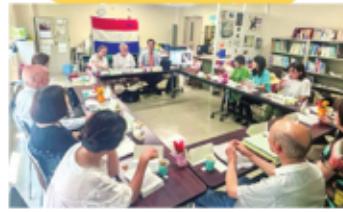
様々な国の言葉や文化を知る講座