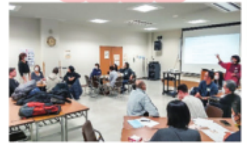
習った日本語を様々な場面で使ってみる、 日本語アクティビティ講座

上記の講座・イベントは令和6年度に実施したものの一例です。 他にも、郡山市国際交流協会ではさまざまな事業を行っています。 お気軽にお問い合わせください。