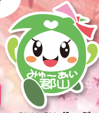
マスコットキャラクター「みゅーあい」