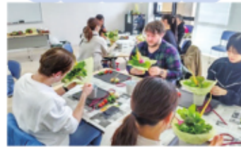
ワイワイおしゃべりしながら ものづくりをする講座