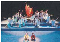
昨年度公演の様子

「市民でつくる演劇」第3弾は 新解釈版「アリとキリギリス」。 よく知られたものとは一味違ったストーリーで 大人も子供も楽しめる新作劇です。