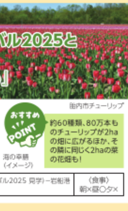
胎内市チューリップ