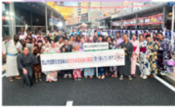
民族衣装や浴衣でうねめ踊り流しへ参加