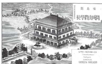
(福島県管下安積郡桑野村開成館の図)