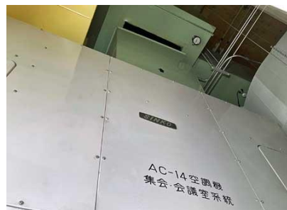
⑦ 集会室・会議室系統空調機 (4階機械室)ダクト損傷