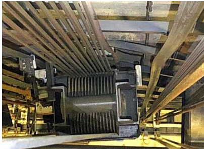
② 大・中ホール舞台吊物装置昇降用レール変形 (上部から)