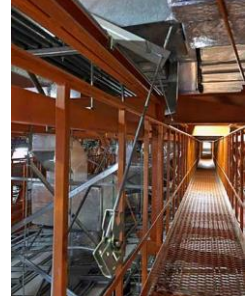
③ 大ホール 客席空調用ダクト吊り金具脱落