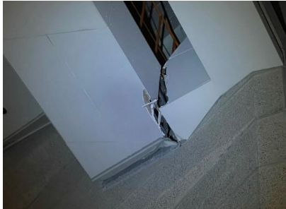
① 大ホール客席天井一部損傷