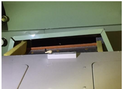
⑥ 大ホール客席系統空調機 (5階機械室)ダクト損傷