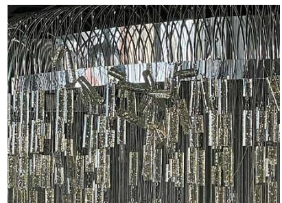
⑧ シャンデリア装飾 落下及び絡み