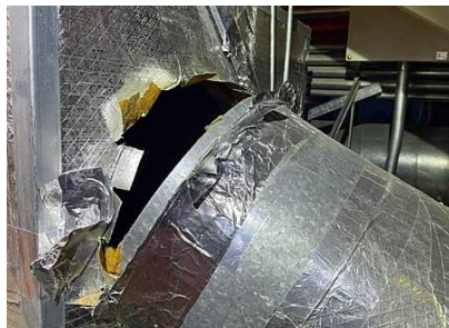
④ 大・中ホール 客席空調用ダクト損傷