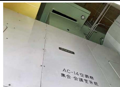
⑧ 集会室・会議室系統空調機 (4階機械室)ダクト損傷