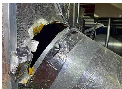
④ 中ホール 客席空調用ダクト損傷