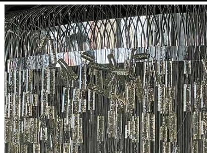
⑨ シャンデリア装飾 落下及び絡み