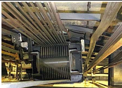
② 大・中ホール舞台吊物装置昇降用レール変形 (上部から)