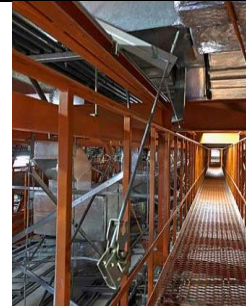
③ 大ホール 客席空調用ダクト吊り金具脱落