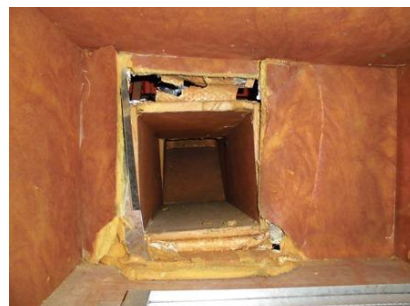
⑤ 大ホール 客席空調用ダクト損傷