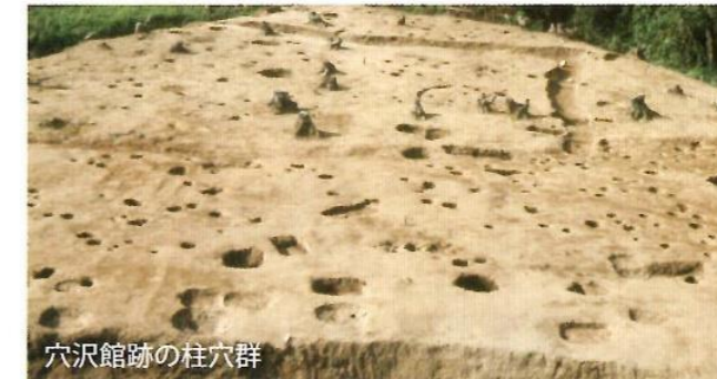
穴沢館跡の柱穴群