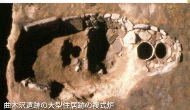
曲木沢遺跡の大型住居跡の複式炉