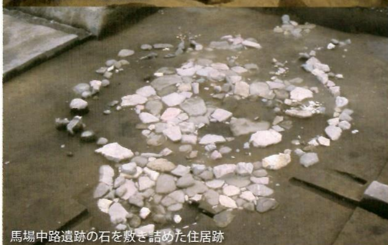
馬場中路遺跡の石を敷き詰めた住居跡