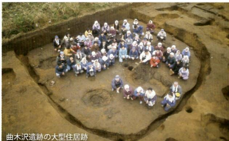
曲木沢遺跡の大型住居跡