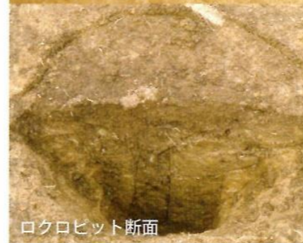
ロクロピット断面