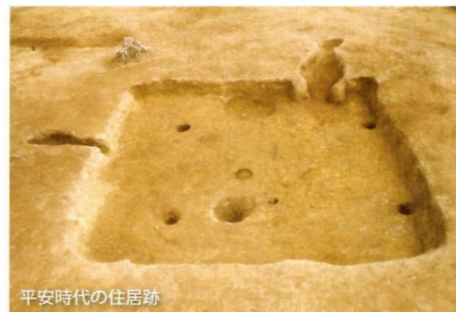
平安時代の住居跡

広網遺跡では平安時代の集落と、土器を焼いたと思われる窯が見つかりました。この集落の住居跡にはロクロの軸を固定したと思われる穴(ロクロピット)が作られており、土器作りの工人たちが住んでいたものと思われます。