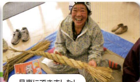
見事にできました!