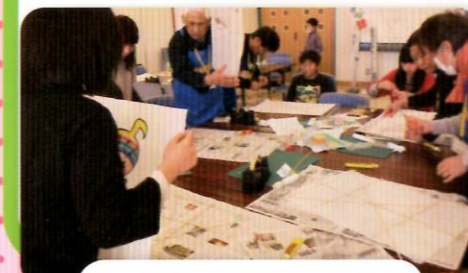
アドバイス付きの凧づくり

むかし遊び体験は、恒例となりました凧づくりと凧あげでした。参加者の中には、ものを作って遊んだ経験がないという子どもさんが多く、紙と竹ひごだけが材料という凧づくりに悪戦苦闘です!それでも、経験豊富なボランティアのアドバイスで凧ができる嬉しそうに走り回って凧をあげていました。当日は強風のために壊れる凧が続出しましたが、何度も直して凧あげに挑む参加者のみなさんの姿がとても印象的でした。