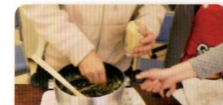
できあがりを集めて…

寒冷で雑菌の少ない季節ということで、「古代のチーズ」といわれる「蘇(そ)」を作って試食しました。「蘇」は生乳をこげないようにゆっくりと煮詰めて作ります。参加者のみなさんは、初めは火加減にとまどっていたようですが、次第に手なれた調子で交代しながら鍋をかき回していました。できあがるまでは「蘇」についての解説です。当時の蘇をはじめとした乳製品は貴人だけが食べられた食品で非常に貴重なものでした。試食では「自然の味で美味しかった。」「チーズは古代からあったのですね。」といった感想が寄せられました。