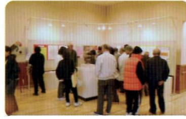
たくさんの方にご覧いただきました。

来年度は「美術館の古墳」として知られる「蒲倉古墳群」を予定しています。お楽しみに!