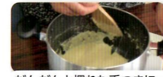
だんだんと慣れた手つきに…