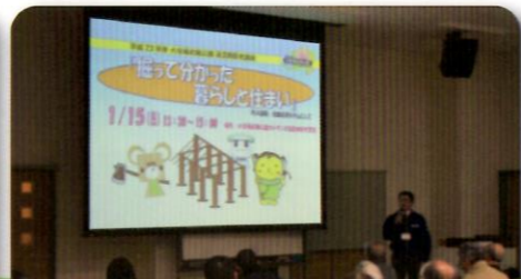
第2回は時代順の続きも。