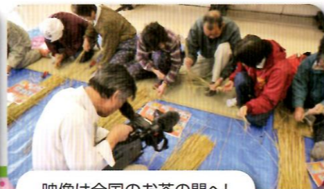
映像は全国のお茶の間へ!