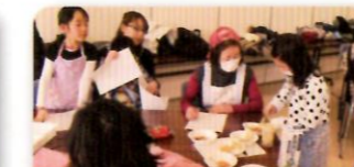
みんなで分けます。

寒冷で雑菌の少ない季節ということで、「古代のチーズ」といわれる「蘇(そ)」を作って試食しました。「蘇」は生乳をこげないようにゆっくりと煮詰めて作ります。参加者のみなさんは、初めは火加減にとまどっていたようですが、次第に手なれた調子で交代しながら鍋をかき回していました。できあがるまでは「蘇」についての解説です。当時の蘇をはじめとした乳製品は貴人だけが食べられた食品で非常に貴重なものでした。試食では「自然の味で美味しかった。」「チーズは古代からあったのですね。」といった感想が寄せられました。