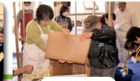
漉いた紙を重ねる。