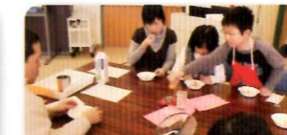
試食では現代とのコラボも!