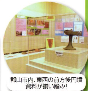
郡山市内、東西の前方後円墳資料が揃い踏み!