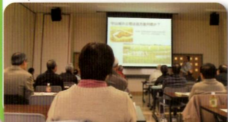
調査担当者の説明を聞く参加者のみなさん

第2回目は「掘って分かった暮らしと住まい」と題し、古代～近世の住居や建物を概観する講座を開催。前年度からの通史的講座の続きでしたが、「写真資料がよかった」「くわしくわかりやすかった」といった感想をいただきました。