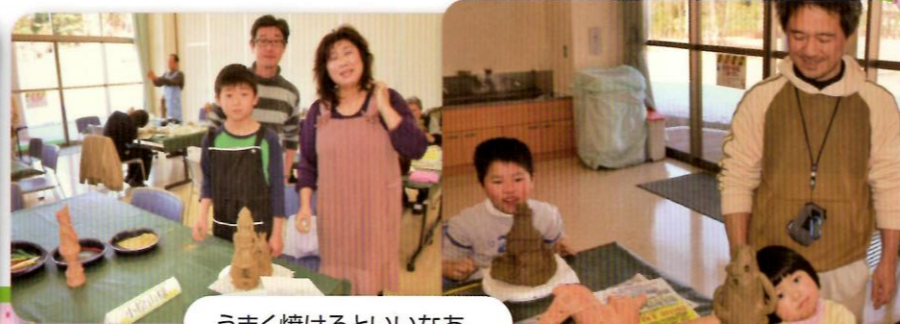
うまく焼けるといいなあ。