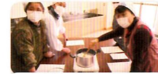
たっぷりの生乳からスタート