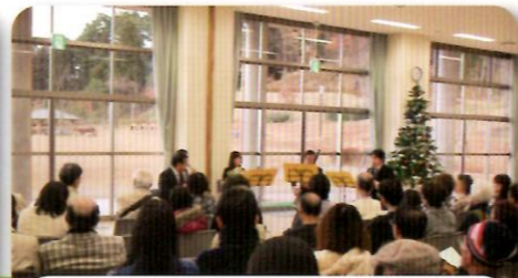
今年は文化センター主催のクリスマスコンサート会場にもなりました。