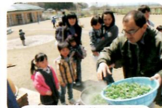
アク抜ききって熱いんだね。