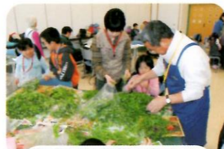
食べられる部分はどこかな。