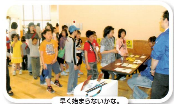
早く始まらないかな。

を数えるほどに白熱した闘いとなりました。参加された皆さんや応援の方々、大変お疲れさまでした。なお、同時開催の「公園の市」も市価よりお得だと大変なご好評をいただいたようです。地元の田村町商工会や「かあちゃんの里」、「夕焼け市」の有志による市は、おなじみとなったようです。