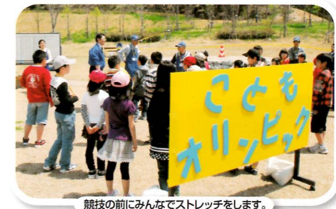
競技の前にみんなでストレッチをします。