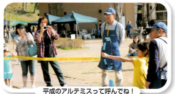
平成のアルテミスって呼んでね!