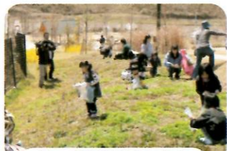
あっ、ここにもあった♪

また、「グルメ体験」終了後には、試食のみの当日参加も受け付け、のべ65名のみなさまに参加していただくことができました。