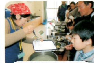
僕は何を食べようかな。