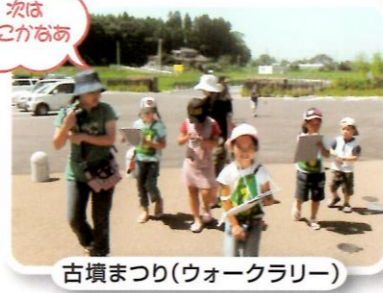
古墳まつり(ウォークラリー)