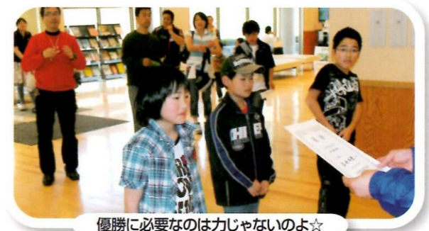
優勝に必要なのは力じゃないのよ☆