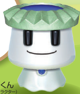
大安場くん (史跡公園キャラクター)

この手引き書は、幼稚園・保育所や小学校・中学校、公民館活動などの各種団体に蔭山工務店大安場史跡パーク(大安場史跡公園)を有効に活用していただくために作成したものです。当史跡公園の利用に際してご一読いただき、お役立てください。皆様のご来園をお待ちしております。