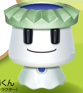
大安場くん (史跡公園キャラクター)

この手引き書は、幼稚園・保育所や小学校・中学校、公民館活動などの各種団体に大安場史跡公園を有効に活用していただくために作成したものです。当史跡公園の利用に際してご一読いただき、お役立てください。皆様のご来園をお待ちしております。